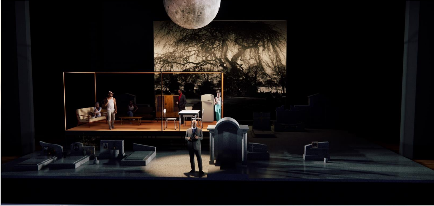
Foto van de maquette van het decorontwerp (geeft alvast een indruk van hoe het gaat worden)